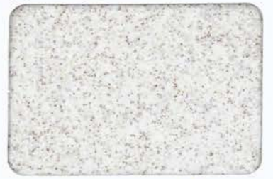
Granipastel Roller GR-25 (GS-25)